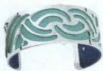
Les Georgettes by Altesse