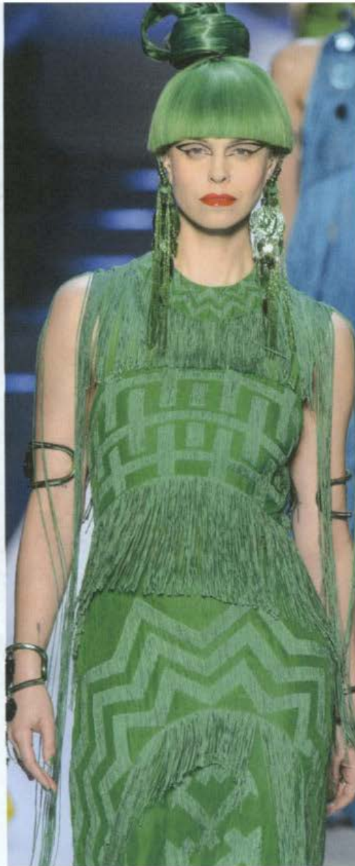
Jean Paul Gaullier Haute Couture