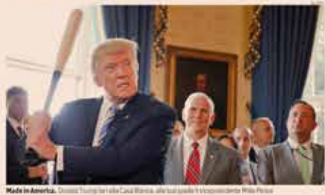
Made in America. Donald Trump con Luca Berlusconi, altri due leader di imprenditori Usa in Europa

Resta l'Obamacare. Contro Trump quattro senatori dissidenti